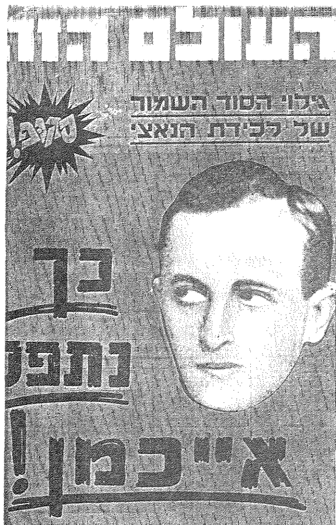
השער הקדמי — אפריל 1960. בשער זה, בדרך כלל, בא לידי ביטוי הצד הרציני-ענייני של העתון

כן, רצינו לשנות ללא היכר את פני העתונות בארץ. רצינו לקרוא תגר על שלטון המפלגתיות. רצינו לתת בטוי לדור החיילים שחזר זה עתה משדות-הקרב של מלחמת-תש"ח, ושסלד באופן אינסטנקטיבי מפני הרוח שהשתררה בעורף. רצינו להיות עתון חי, לוחם, תוקפני. עתון שיגיד לכל אחד את האמת בפרצוף, ללא חשבון.