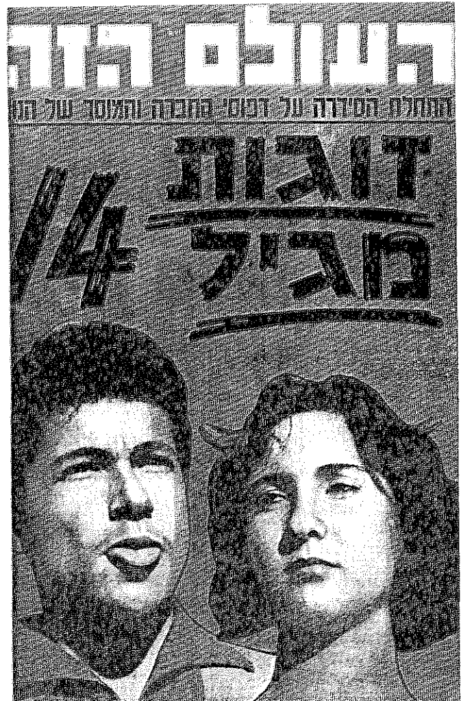
השער האחורי — אפריל 1960. בשער זה, בדרך כלל, הופיעו נושאים פיקנטים ורכילותיים

ציפנו סידרת תצלומים שצולמה עליידי מקסים סלומון, שהיה אז צלם-המערכת. בין השאר כללה תצלום של חיילת מסתרקת במשרד-צבאי. תצלום זה הוסיף שמן על המדורה — כי משרד-הבטחון טען לאחר-מכן שביימנו את התמונה בזרז, כדי להוכיח שהחיילות מתבטלות. סלומון נשבע כי התמונה לא בווימה. השנה פגשתי במקרה את הנערה (עתה כבר מותר לומר שהיא אשה) ולה היתה גירסה שלישיית: בראותה את המצלמה בידו