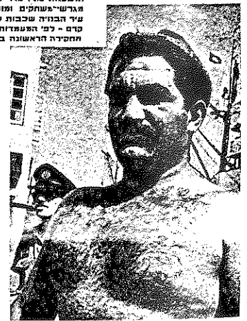
272 דיסה: הטוב והרע, עמוד מתוך נכיון העולם הזה 1954.

ימים. אין האמיתי יה. תחת או לקול זי "קול